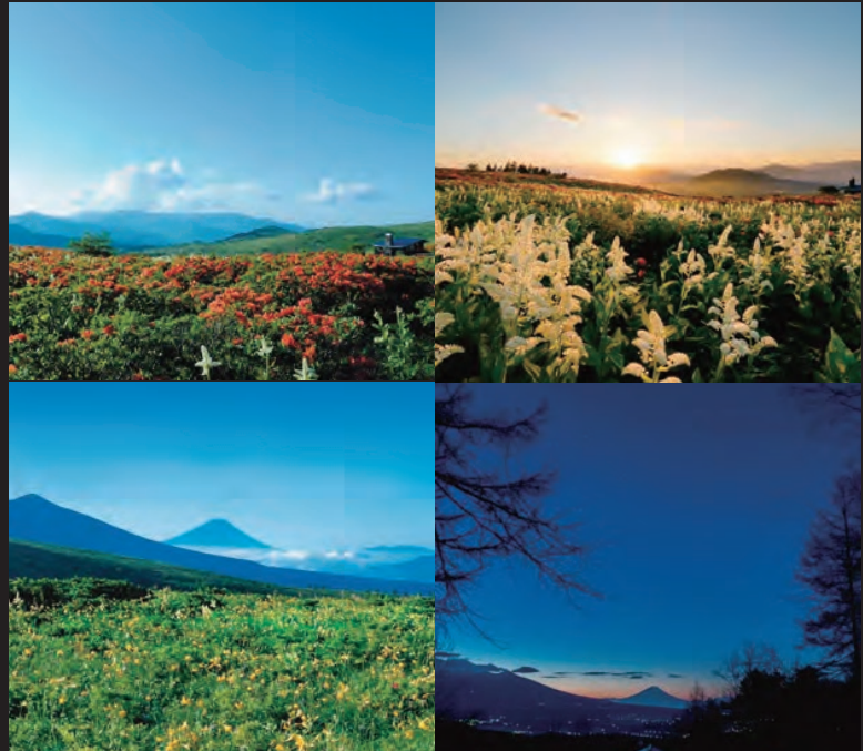
ビバルデの丘 周辺写真

物件概要 ■別荘地(秋の丘) ●所在地: 諏訪市大字四賀字霧ヶ峰7718-3内 ●今回販売区画: 8区画 ●土地面積: 1,038㎡~1,268㎡ ●価格: 1,125万円~1,570万円 ●最多価格帯: 13,000万円台(3区画) ●共用施設等大修理基金: 80万円(残金決済時一括預かり) ●水道協力金220,000円(税込) ※建築時必要 ●共用施設維持管理費: 4,950円/月(税込) ●水道管理費(個人別荘の場合): 1,100円/月(税込)